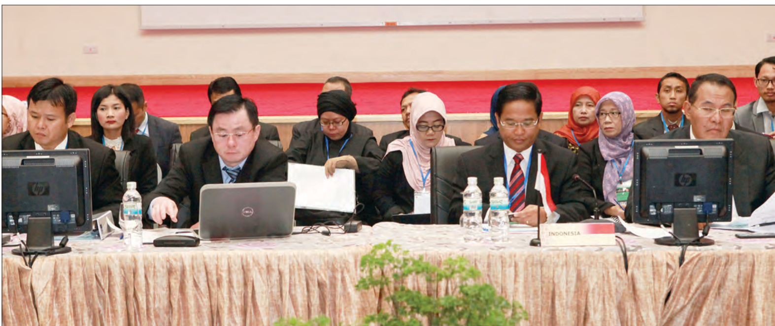
PEGAWAI-PEGAWAI Kanan Kementerian Kesihatan dan dari negara ASEAN, China, Jepun dan Republik Korea hadir pada Mesyuarat Pegawai-Pegawai Kanan mengenai Pembangunan Kesihatan (Senior Officials Meeting on Health Development - SOMHD) Kali Ke-12 dan Mesyuarat Berkaitan.

Mesyuarat SOMHD diadakan setiap tahun bertujuan untuk mengkaji pelaksanaan misi yang digariskan dalam setiap mesyuarat SOMHD sebelumnya dan melaksanakan aktiviti, komitmen dan kenyataan bersama untuk dikemukakan kepada Mesyuarat Menteri Kesihatan ASEAN (AHMM) yang diadakan setiap dua tahun sekali.