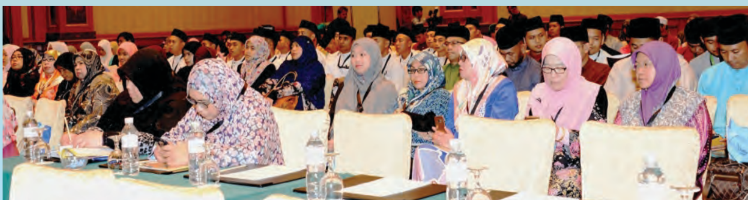
ANTARA peserta pada Seminar BASMIDA yang berlangsung pada 1 Safar 1438 bersamaan 1 November 2016 yang diadakan di The Empire Hotel & Country Club, Jerudong, Negara Brunei Darussalam.

(Titah sempena Sambutan Hari Guru 23 September 2014).