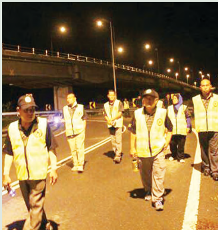
UNIT Pengawasan Kejiranan Balai Polis Bangar, Daerah Polis Temburong menjalankan rondaan pencegahan jenayah gandingan dengan Pengawasan Kejiranan Kampung Puni.