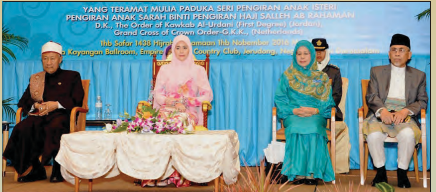
YANG Teramat Mulia Paduka Seri Pengiran Anak Isteri Pengiran Anak Sarah binti Pengiran Haji Salleh Ab. Rahaman selaku tetamu kehormat pada Seminar BASMIDA.

Justeru, pemerkasaan nilai-nilai mulia dan