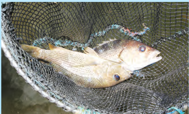
PELBAGAI jenis ikan yang diternak.