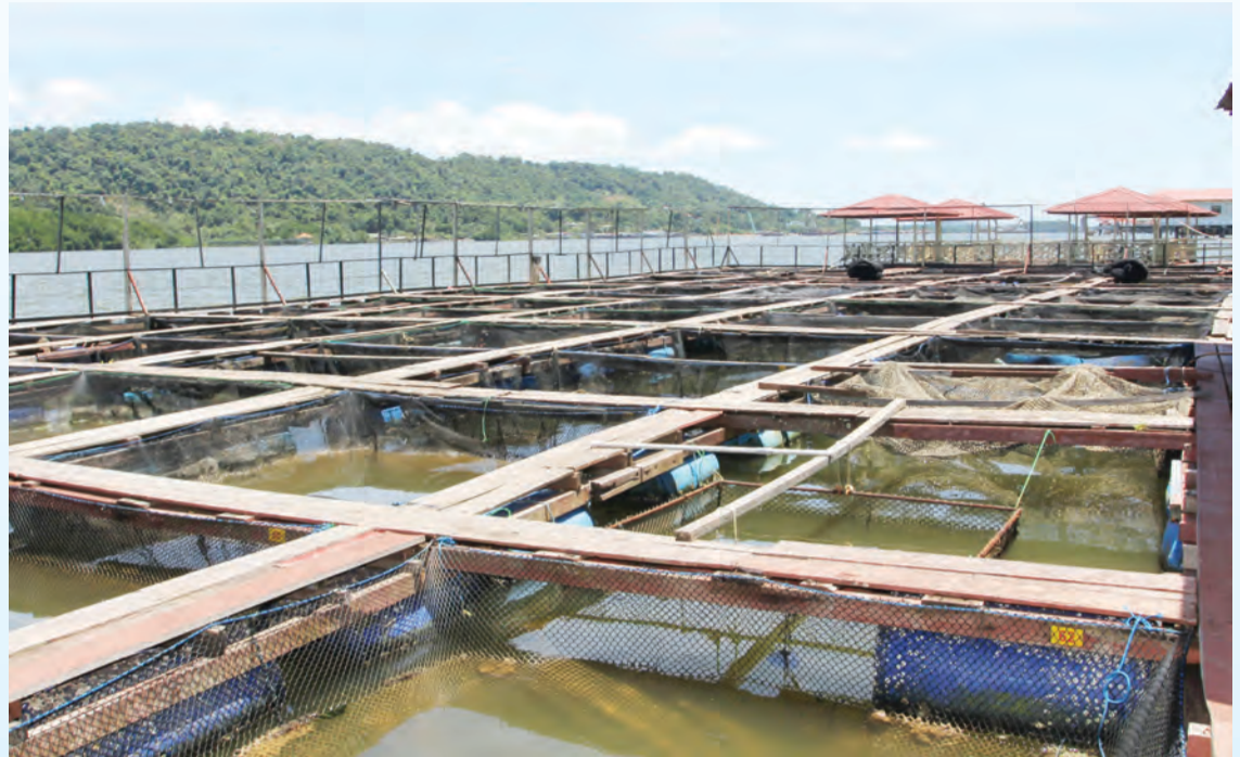
TAPAK Industri Pemeliharaan Ikan Dalam Sangkar milik Syarikat Namara Aquaculture yang terletak di Sungai Bunga.

Pada tahun 2016 Syarikat telah mencapai peningkatan sebanyak 6.6 metrik tan dan mampu menjana sebanyak 26% pengeluaran dari sasaran berjumlah 25.6 metrik tan. Pada tahun 2017, ke arah melaksanakan visi pihak Kementerian Sumber-Sumber Utama dan Pelancongan, Syarikat akan meningkatkan bilangan sangkar kepada 175 buah dan akan terus memastikan pengurusan dalam mengoperasikan sangkar ikan akan sentiasa berjalan dengan lancar dan teratur, memastikan stok ikan untuk klien menepati keperluan, meningkatkan lagi jumlah petak sangkar yang ada serta memastikan penggunaan teknologi teratur dan memperluaskan lagi perniagaan tempatan ke arah pengeksportan.