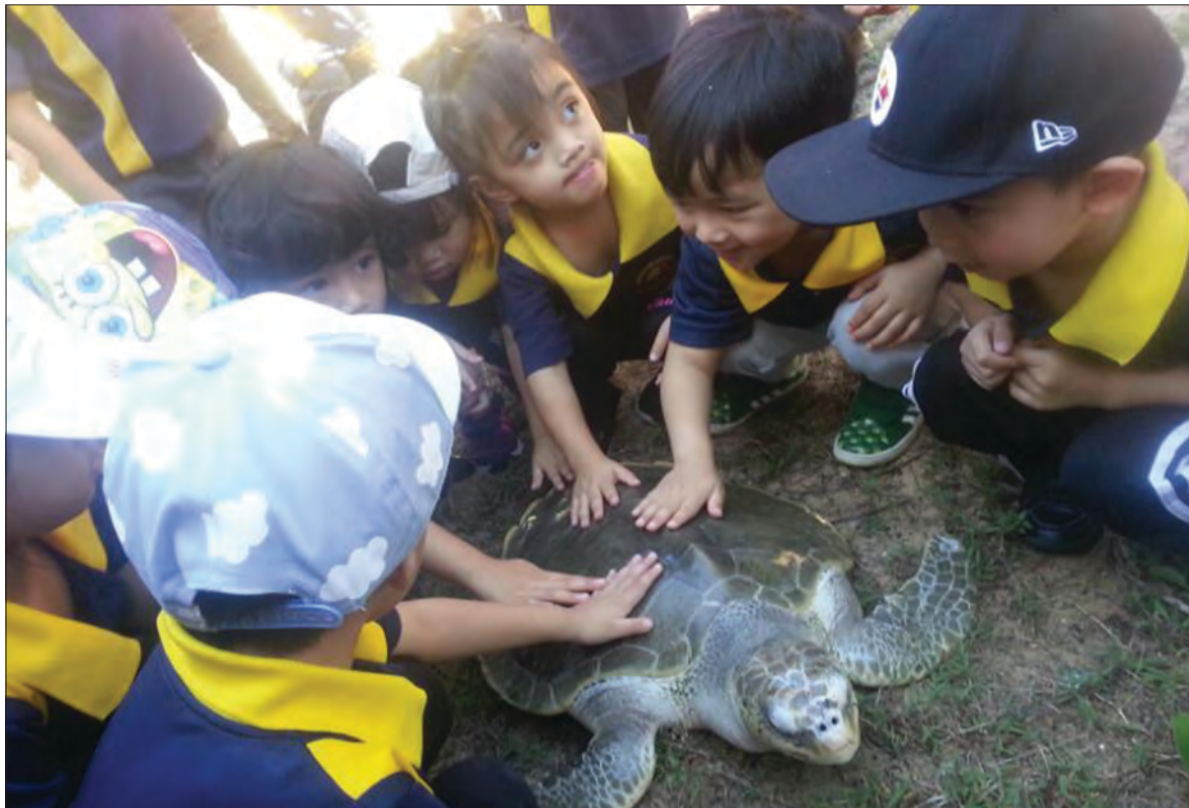
KANAK-kanak Taman Asuhan 1, Taman Asuhan Kanak-Kanak Yayasan Sultan Haji Hassanal Bolkiah berkesempatan untuk memegang penyu yang ada di Pusat Pemeliharaan Penyu Meragang.