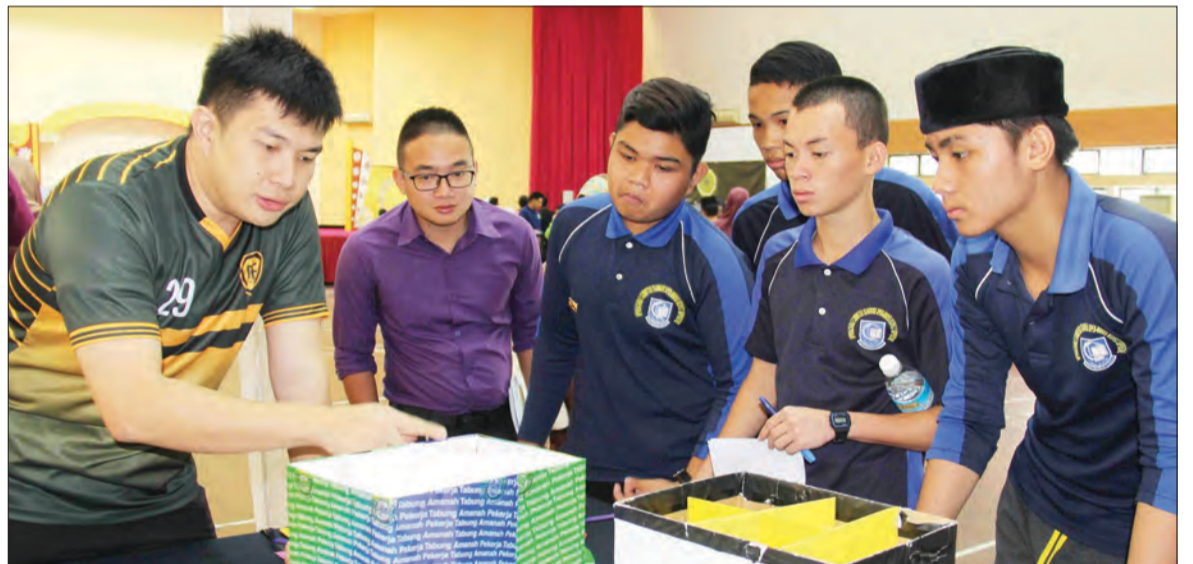
PARA pelajar dari Daerah Temburong ketika menyaksikan pameran sempena Jerayawara 'Generasi Celik Kewangan' yang dianjurkan oleh Autoriti Monetari Brunei Darussalam (AMBD).

Acara-acara seterusnya yang akan diadakan bersempena dengan Hari Menabung Kebangsaan 2017 adalah Financial Fun Fair di Jerudong Park Colonnade pada hari Ahad, 30 April 2017, dari jam 2 petang hingga 10 malam. Acara ini akan menampilkan pelbagai program keluarga dan aktiviti interaktif yang bertemakan pengurusan kewangan secara berhemat dan Financial Showcase pada hari Sabtu, 20 Mei 2017 bermula pada jam 2.00 petang hingga 8.00 malam bertempat di Airport Mall.