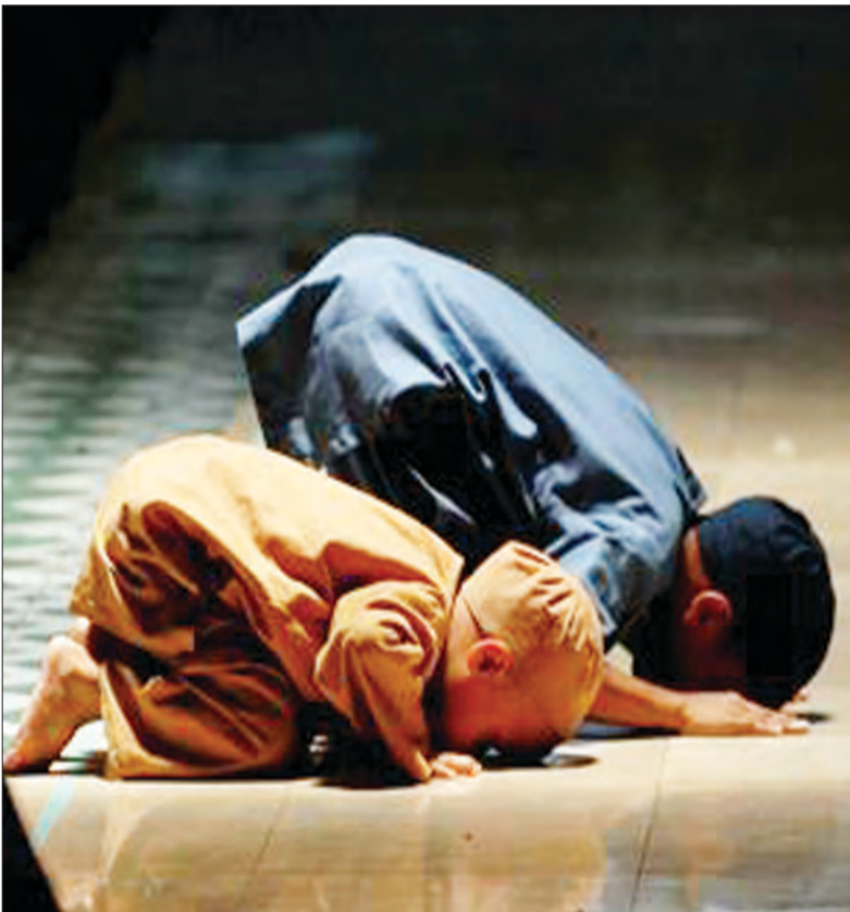
MENDIDIK anak-anak untuk sembahyang perlu bermula dari kecil.

Oleh : Hajah Siti Zuraihah Haji Awang Sulaiman