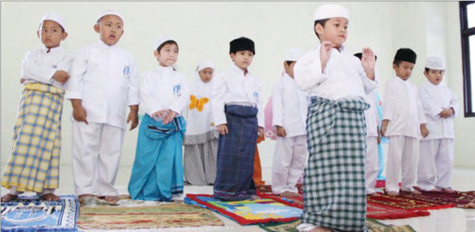
UNTUK memastikan anak-anak mengerjakan sembahyang lima waktu bukan perkara mudah, jadi mereka perlu ada didikan ugama yang kukuh.

Oleh : Hajah Siti Zuraihah Haji Awang Sulaiman