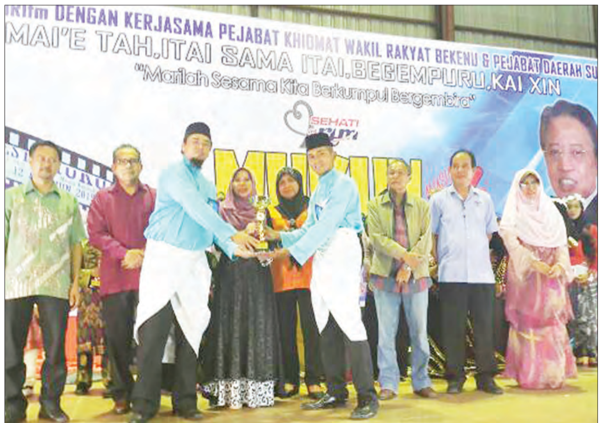
KUMPULAN Mukun Selendang Sutera dari Negara Brunei Darussalam juara Pertandingan Mukun Se-Borneo Musim Ke-4 2017.

Berita dan Foto : Ihsan Faridah Haji Ibrahim