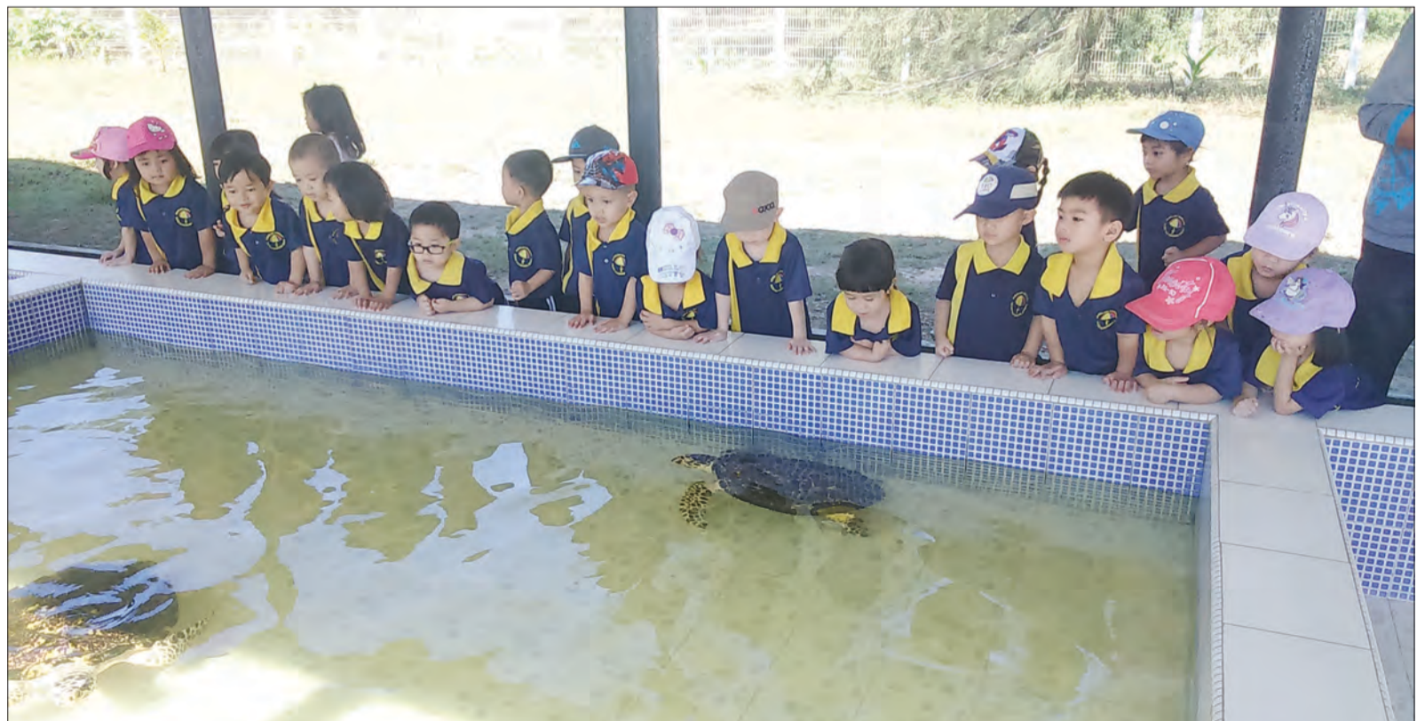
KANAK-kanak Taman Asuhan 1, Taman Asuhan Kanak-Kanak Yayasan Sultan Haji Hassanal Bolkiah ketika membuat lawatan sambil belajar ke Pusat Pemeliharaan Penyu Meragang.

Tujuan lawatan itu diadakan bagi memberi pengetahuan kepada kanak-kanak tentang pentingnya memelihara dan menjaga spesies terancam seperti penyu.