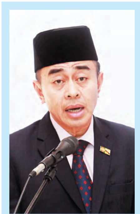
MENTERI Kesihatan, Yang Berhormat Dato Seri Setia Dr. Awang Haji Zulkarnain bin Haji Hanafi semasa berucap pada Majlis Penyampaian Sijil Akreditasi Joint Commission International (JCI) bagi Pusat Kesihatan Pengkalan Batu pada hari Sabtu, 1 April 2017 Masihi bersamaan 4 Rejab 1437 Hijrah, bertempat di Pusat Kesihatan Pengkalan Batu.

Di kesempatan ini, saya bagi pihak seluruh warga Kementerian Kesihatan menyembahkan setinggi-tinggi menjunjung kasih ke hadapan majlis Kebawah Duli Yang Maha Mulia Paduka Seri Baginda Sultan Haji Hassanah Bolkiah Mu'izzaddin Waddaulah ibni Al-Marhum Sultan Haji Omar 'Ali Saifuddin Sa'adul Khairi Waddien, Sultan dan Yang Di-Pertuan Negara Brunei Darussalam, kerana dengan berkat kepimpinan, limpah kurnia dan keprihatinan Kebawah Duli Yang Maha Mulia jua, Alhamdulillah, rakyat