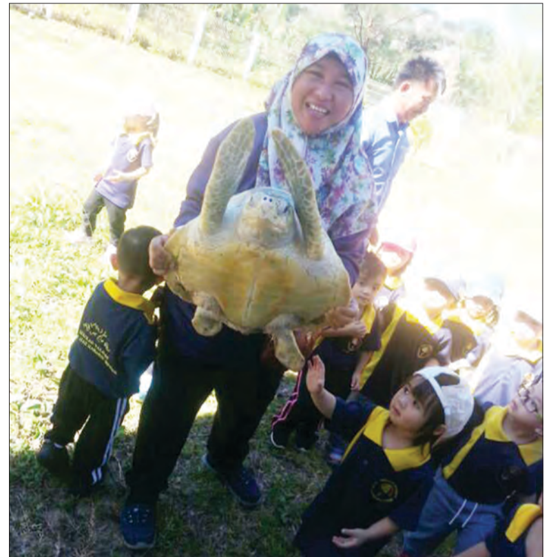
BERKESEMPATAN untuk memegang penyu pada lawatan berkenaan.