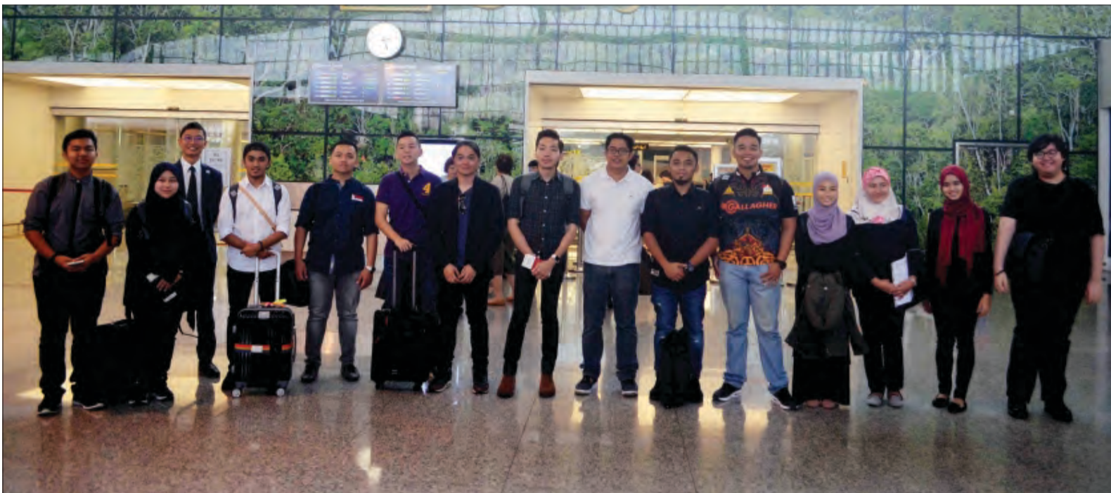
SERAMAI 13 peserta yang terdiri daripada belia-belia yang sudah bekerja, berlepas ke Jepun bagi menyertai Program JENESYS 2016 yang akan berlangsung sehingga 25 April.

Berita dan Foto : Ak. Syi'aruddin Pg. Daudin