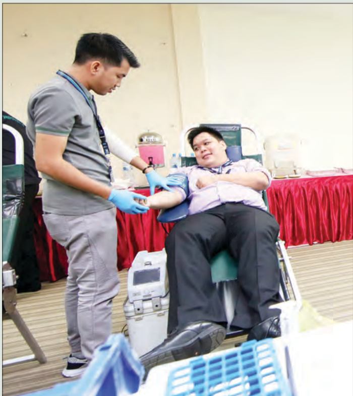
SUASANA warga BGC yang sama-sama memberi sokongan terhadap usaha Pusat Pendermaan Darah Hospital RIPAS.

Acara ini dianggap amalan yang baik yang akan diadakan setiap tahun kerana ia dapat memupuk tanggungjawab di kalangan individu terutama dalam pemikiran membantu pesakit yang memerlukan jenis darah tertentu dengan segera.