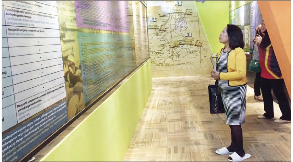
PENGUNJUNG dari luar negara turut tidak melepaskan peluang melawat Galeri Pameran Pusat Sejarah.

BANDAR SERI BEGAWAN , Sabtu, 28 Januari. - Galeri Pameran Pusat Sejarah Brunei (PSB) diharapkan akan dapat menanam perasaan serta menguatkan rasa kecintaan juga taat setia rakyat dan penduduk di negara ini kepada raja, agama, bangsa serta negara khususnya generasi muda.