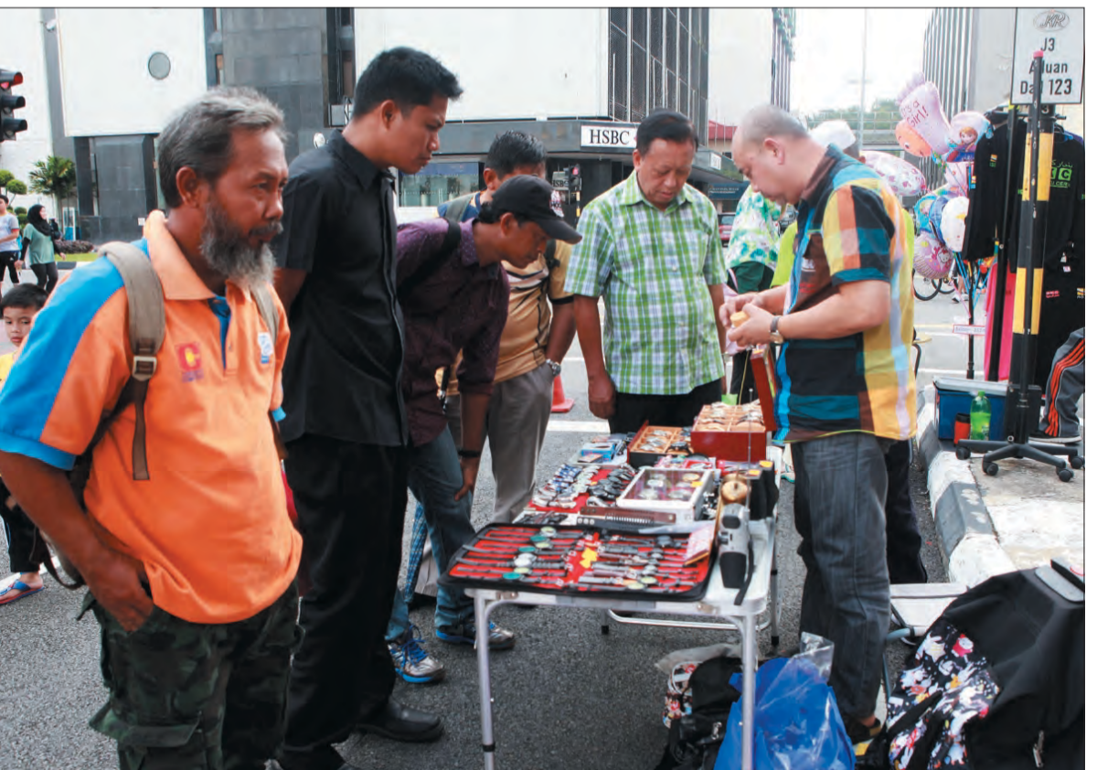
KELIHATAN orang ramai mengerumuni seorang peniaga yang menjual pelbagai jenis koleksi jam tangan.