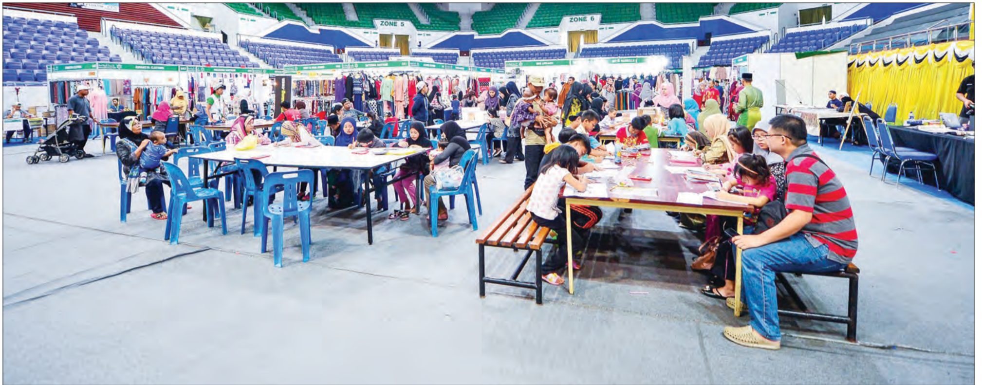
PELBAGAI lapisan masyarakat yang berkunjung sama-sama memeriahkan lagi Karnival Cinta Rasul.

Oleh : Marlinawaty Hussin