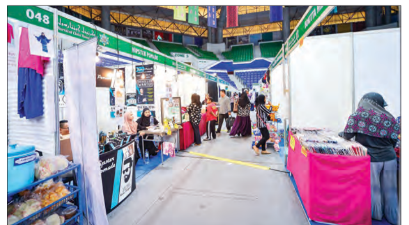
GERAI-GERAI jualan yang mengambil bahagian pada Karnival Cinta Rasul.