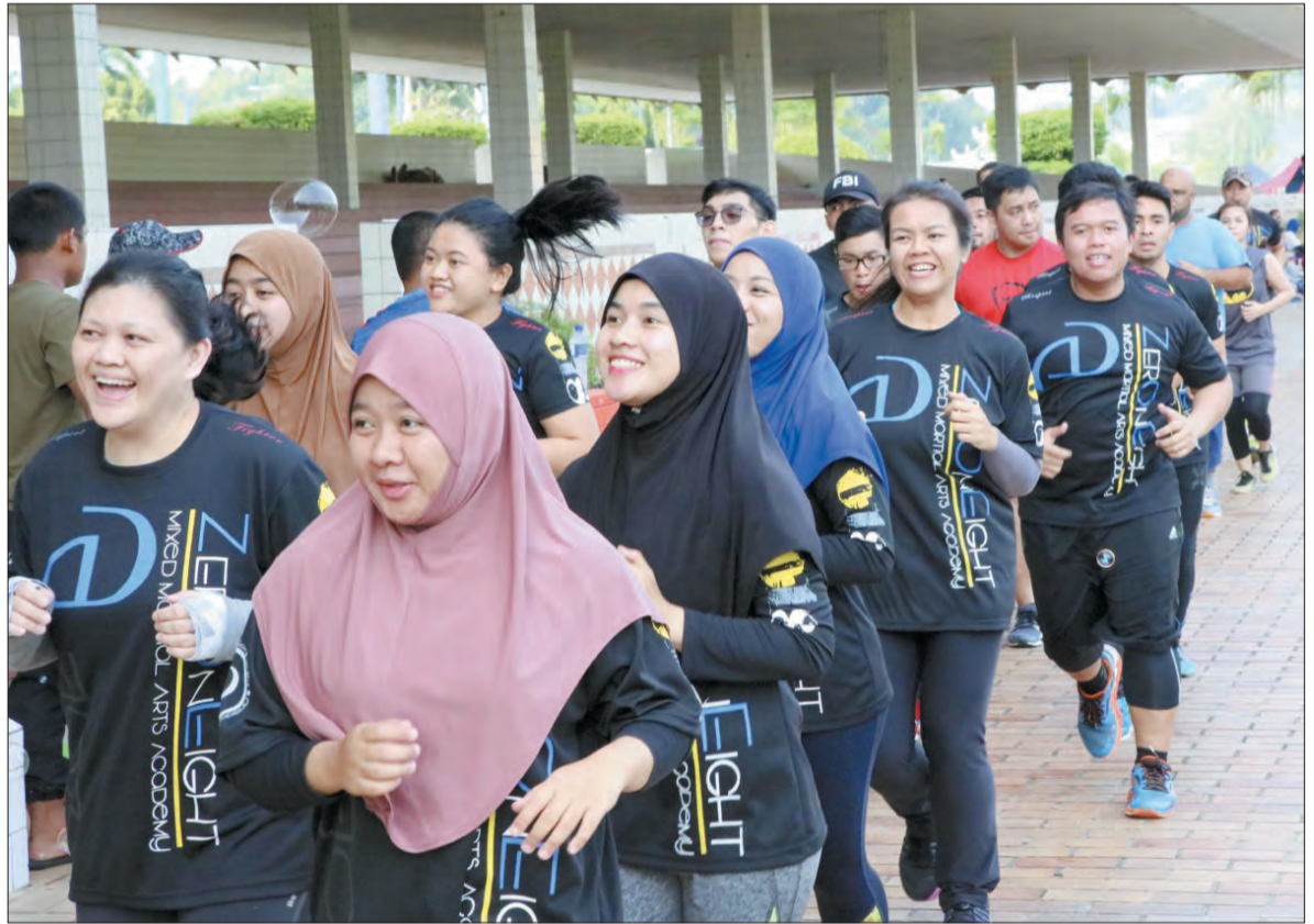
AKTIVITI berjoging antara yang mengisi Program Bandarku Ceria.

Jelasnya, tujuan Zero One Eight MMAA ditubuhkan adalah