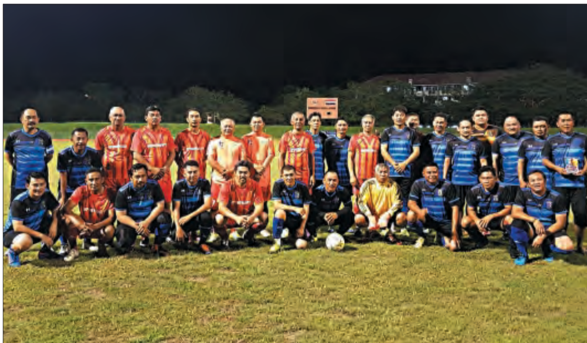
PASUKAN Bola Sepak X.BES Reunited (jersi biru) dan Lavesta, Wilayah Persekutuan Labuan (jersi merah) bergambar ramai sebelum perlawanan persahabatan tersebut.

Berita : Ihsan Ahmad Ajeeb