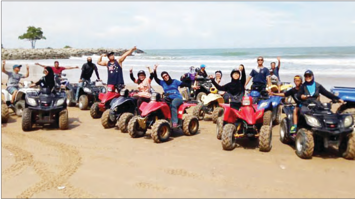
SUKAN ATV yang kini menjadi kegemaran orang ramai terutama sekali beriadah pada hujung minggu dan tidak kurang juga pada musim cuti persekolahan.

Oleh : Wan Mohamad Sahran Wan Ahmadi