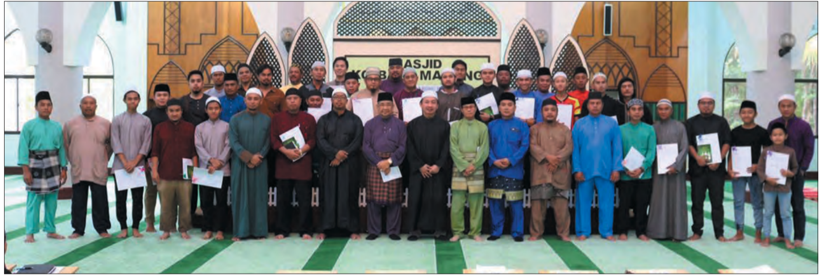
SERAMAI 58 peserta mengikuti Kursus Fardhu Kifayah yang diadakan di Masjid Kampung Batu Marang.