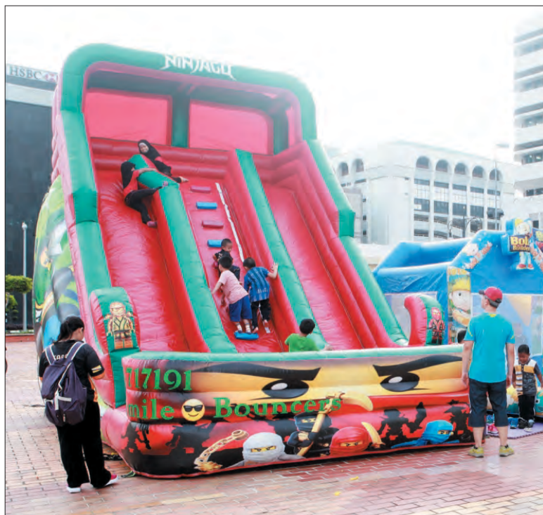
PERMAINAN bouncer antara yang menarik perhatian pengunjung kanak-kanak Bandarku Ceria.

Namun dalam melakukan sebarang aktiviti riadah ini, orang ramai khususnya ibu bapa dan penjaga juga turut diingatkan untuk sentiasa memastikan keselamatan keluarga terutama kanak-kanak kecil, yang mana dalam beriadah kita perlu sentiasa peka tentang keberadaan anak-anak agar mereka tidak berada terlalu jauh dari pandangan mata ataupun pengawasan ibu bapa ataupun bermain di tempat-tempat yang membahayakan serta boleh mengancam keselamatan.