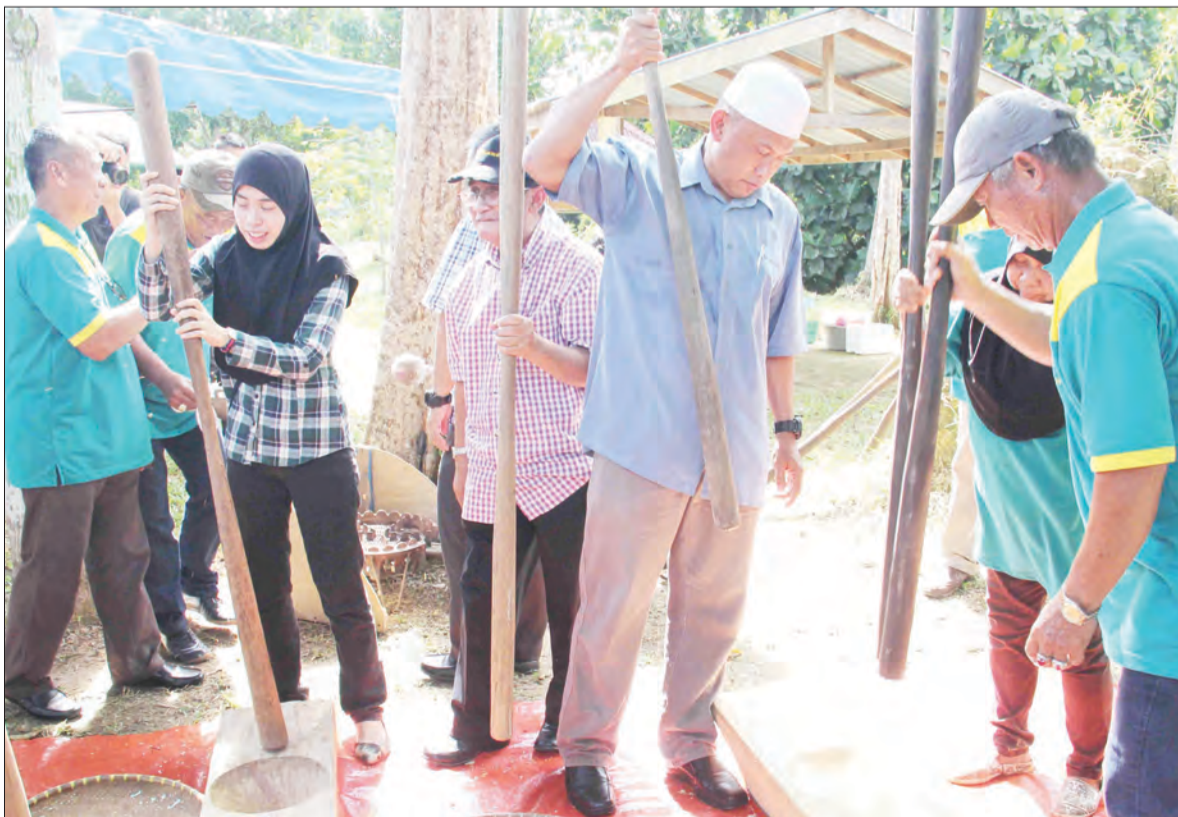
PENGUNJUNG turut menyertai aktiviti menarik semasa pesta ini.