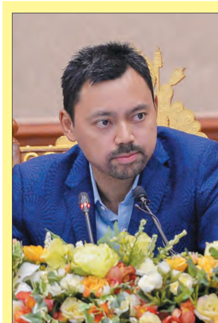
SABDA Duli Yang Teramat Mulia Paduka Seri Pengiran Muda Mahkota Pengiran Muda Haji Al-Muhtadee Billah ibni Kebawah Duli Yang Maha Mulia Paduka Seri Baginda Sultan Haji Hassanal Bolkiah Mu'izzaddin Waddaulah, Menteri Kanan di Jabatan Perdana Menteri pada Jubli Emas Kebawah Duli Yang Maha Mulia Paduka Seri Baginda Sultan dan Yang Di-Pertuan Negara Brunei Darussalam Menaiki Takhta di Bilik Mesyuarat, West Wing, Tingkat 1, Jabatan Perdana Menteri pada hari Khamis, 28 Rabiulakhir 1438 Hijrah bersamaan 26 Januari 2017 Masihi.

Namun, bukanlah menjadi tujuan kita untuk menyempitkan wawasan bagi masa depan