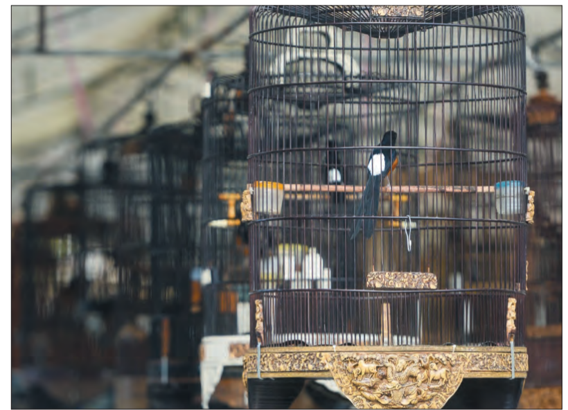
BURUNG Murai Batu adalah antara Burung Murai yang dipertandingkan.

"Pertandingan antara lain bertujuan untuk memeriahkan lagi sambutan Hari Keputeraan Baginda Sultan, di samping mengeratkan silaturahim sesama penggemar burung," jelasnya.