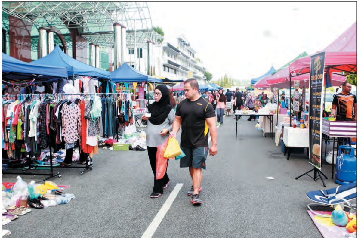
BERBAGAI-BAGAI jualan kelihatan memeriahkan suasana Bandarku Ceria pada setiap hujung minggu.

Sementara di ruang lain sekitar Taman Taman Haji Sir Muda Omar 'Ali Saifuddin pula dibanjiri dengan pelbagai jenis jualan terdiri dari jualan yang berbentuk pakaian, makanan, minuman, aksesori, kasut, pakaian sukan, barang-barang permainan