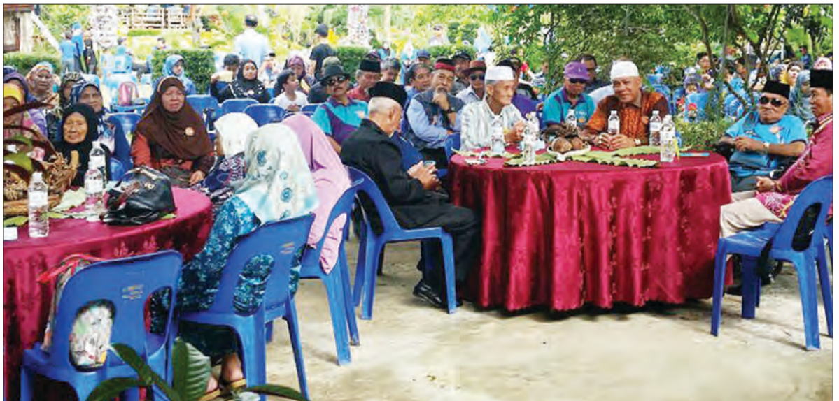
ANTARA ahli-ahli keluarga yang hadir pada Majlis Perhimpunan Warisan DSG.

Melalui bedudun ke pondok-pondok ini katanya lagi, generasi-generasi muda keluarga ini akan mengenali jenis-jenis makanan, di samping mengenali generasi-generasi yang sudah berusia dalam keluarga DSG.