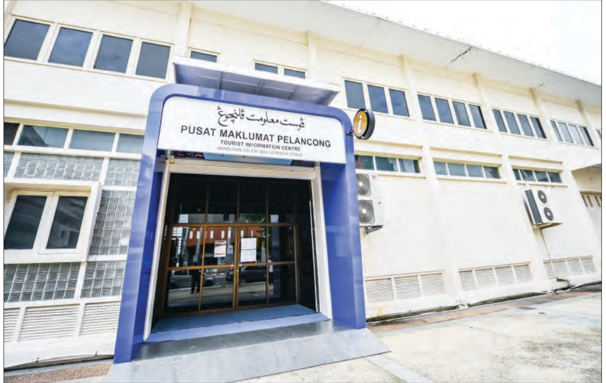
PUSAT Maklumat Pelancong yang terletak di Bangunan Galeri Seni Dermaga Diraja di Bandar Seri Begawan.

BANDAR SERI BEGAWAN , Ahad, 29 Januari. - Sejak mula dilancarkan pada 7 Januari lalu, pameran Jejak Warisan dan pameran karya-karya seni lukis yang bertemakan Tanah Airku Permai telah dikunjungi oleh lebih 700 pengunjung dari luar dan dalam negara.