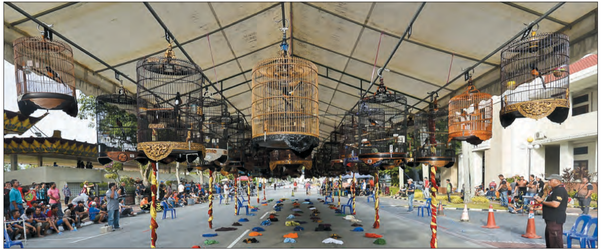
PARA hakim pertandingan dengan teliti mendengarkan kicauan burung-burung Murai yang dipertandingkan.

Pengerusi Jawatankuasa pertandingan berkenaan, Awang Nawi @ A.Nawi bin Ma'arof berkata,