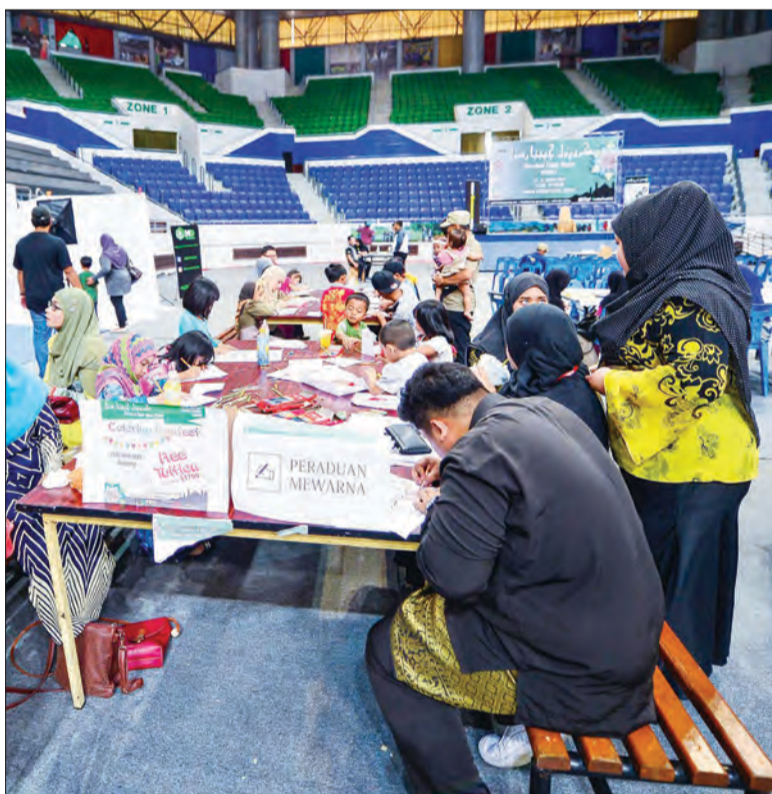
PERADUAN MEWARNA antara aktiviti yang mendapat sambutan pada Karnival Cinta Rasul.

Oleh : Marlinawaty Hussin