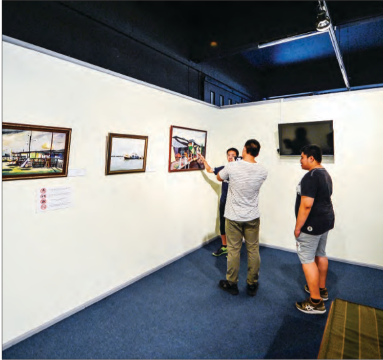
PELANCONG dari dalam dan luar negara melihat pameran-pameran mengenai tempat-tempat yang menarik di Negara Brunei Darussalam (atas dan bawah).