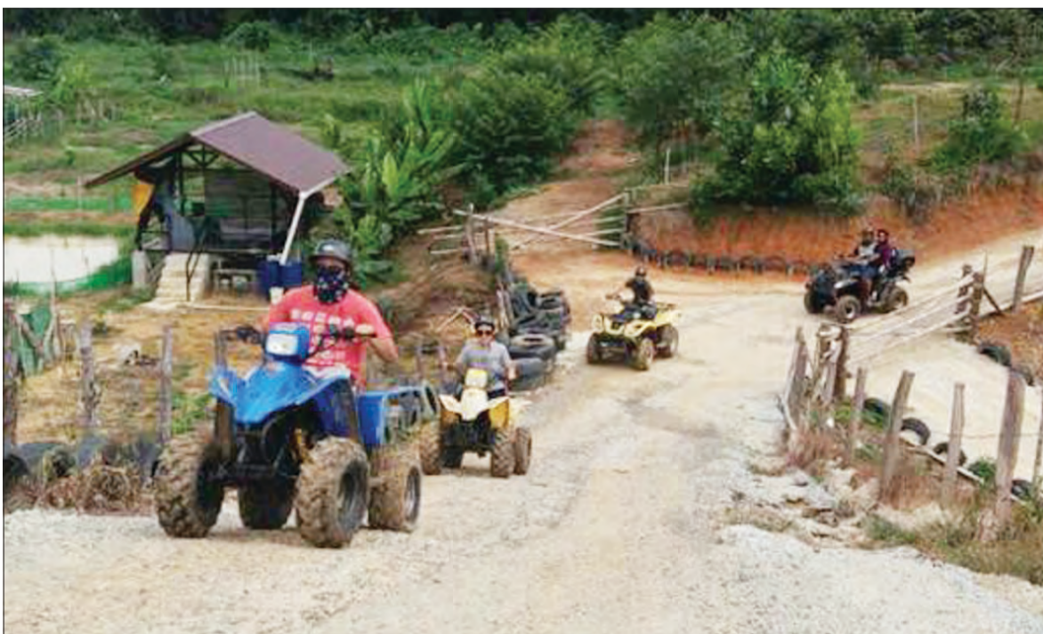
ATV juga boleh digunakan oleh orang ramai semasa menyusuri hutan-hutan kecil dan kebun-kebun serta ladang-ladang tanaman.

Selain itu, AVH ATV Brunei juga menawarkan perkhidmatan-perkhidmatan lain seperti acara-acara persendirian, korporat, karnival, pre-wedding , graduation photoshoot dan sebagainya.