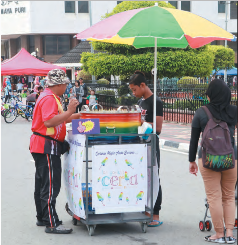
PENJUAL Ice Goyang Ceria ketika melayan pelanggannya.

Oleh : Khartini Hamir