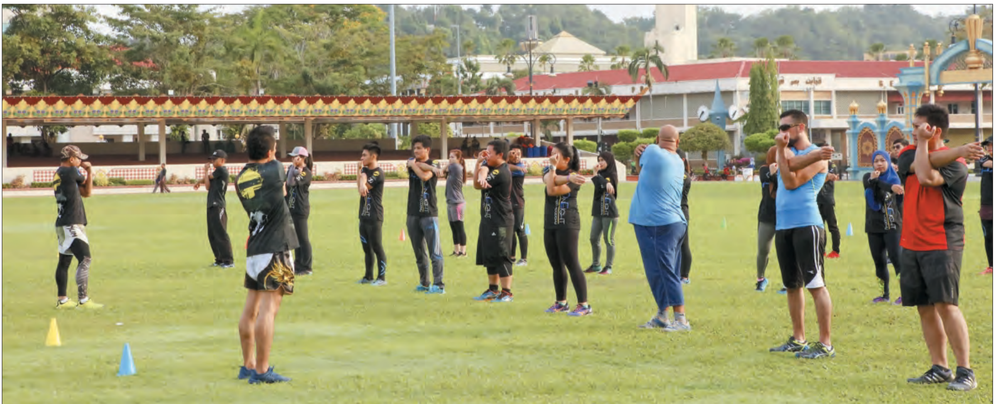
PENGLIBATAN belia-belia memeriahkan lagi Bandarku Ceria.

dengan membuat pendaftaran sebanyak BND50 bagi lapan sesi dalam masa empat bulan, iaitu dua kali seminggu.