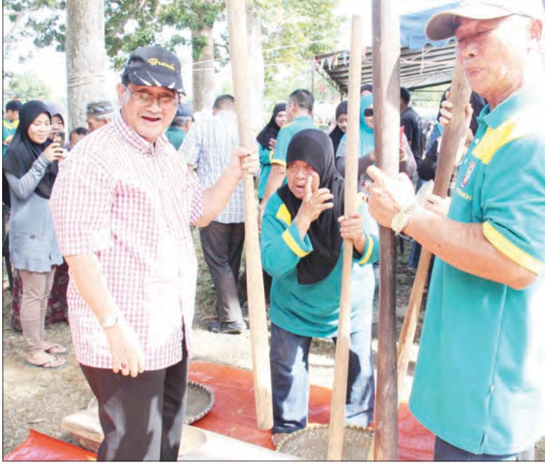
TURUT menyertai aktiviti mengamping pada Pesta Senukoh Kali Ke-2 ini ialah Ahli Majlis Mesyuarat Negara, Yang Berhormat Awang Haji Emran bin Haji Sabtu (kiri).

TEMBURONG, Sabtu, 28 Januari. - Pesta Senukoh Ke-2, 2016 / 17 'Berkenjungan Tah ke Pesta Senukoh' anjuran Majlis Perundingan Kampung (MPK) Senukoh berlangsung meriah dengan lebih 14 acara disusun pada pesta kali ini yang berlangsung di kawasan Balai Raya Kampung Senukoh, di sini.