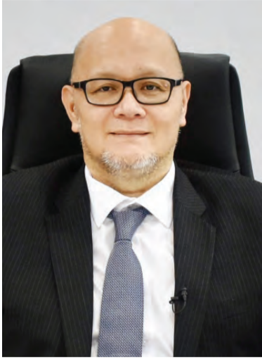
YANG Berhormat Menteri Pendidikan semasa menyampaikan pesanan melalui rakaman video.