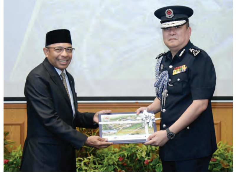
Berita dan Foto : Haji Ariffin Mohd. Noor / Morshidi