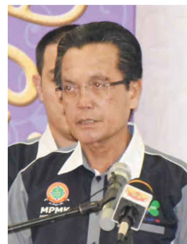
YANG Berhormat Menteri Hal Ehwal Dalam Negeri semasa berucap pada Majlis Penyampaian Hadiah Program Kebelaaan 3K Tahun 2020 Majlis Perundingan Kampung (MPK) Daerah Tutong.

Yang Berhormat berharap dengan adanya geran keusahawanan ini ia akan menjadi satu pencetus ( catalyst ) kepada peningkatan bilangan