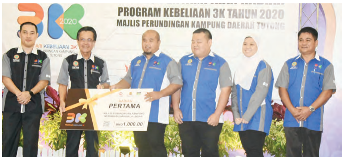
YANG Berhormat Menteri Hal Ehwal Dalam Negeri semasa hadir selaku tetamu kehormat pada penyampaian hadiah kepada johan Program Kebelaaan 3K Tahun 2020 MPK Daerah Tutong dimenangi oleh MPK Merimbun dan Kuala Ungar.

Kumpulan belia diberi tempoh selama empat bulan untuk memulakan dan melaksanakan projek-projek yang berpotensi