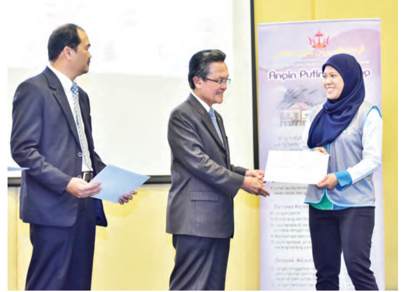
YANG Berhormat Menteri Hal Ehwal Dalam Negeri semasa memakaikan vest DPC kepada salah seorang peserta (kiri). Manakala gambar atas, Yang Berhormat menyampaikan sijil pengiktirafan kepada salah seorang peserta.

Mereka juga dihasrat akan dapat membantu NDMC tambahan, Jabatan Daerah selaku DDMC