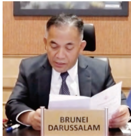
YANG Berhormat Menteri Sumber-Sumber Utama dan Pelancongan semasa berucap pada mesyuarat tersebut yang diadakan secara persidangan video.

Mesyuarat ini dimulakan dengan Mesyuarat Pertubuhan Pelancongan Kebangsaan ASEAN (NTO) Ke-53 dan