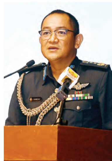
PEMERINTAH ABDB yang juga selaku Pengerusi Jawatankuasa Kerja Keselamatan Maritim (JKKM) semasa berucap.

Turut hadir, Pegawai-pegawai Kanan agensi keselamatan dan ahli-ahli di dalam JKPU dan JKKM.