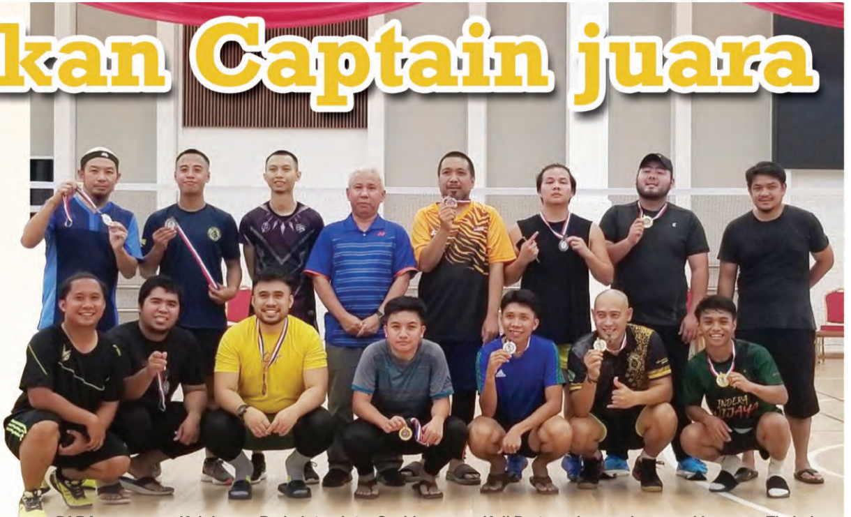
PARA pemenang Kejohanan Badminton Inter Syahkampung Kali Pertama bergambar ramai bersama Timbalan Presiden Persatuan Badminton Kebangsaan Brunei Darussalam (PBKBD), Awang Zaini bin Haji Puasa yang juga hadir bagi menyampaikan pingat-pingat kemenangan pada kejohanan tersebut.

Syahkampung yang telah berkecimpung dalam sukan futsal selama 20 tahun itu turut merancang untuk menganjurkan kejohanan sukan selain futsal dalam masa terdekat ini seperti pingpong dan olahraga.