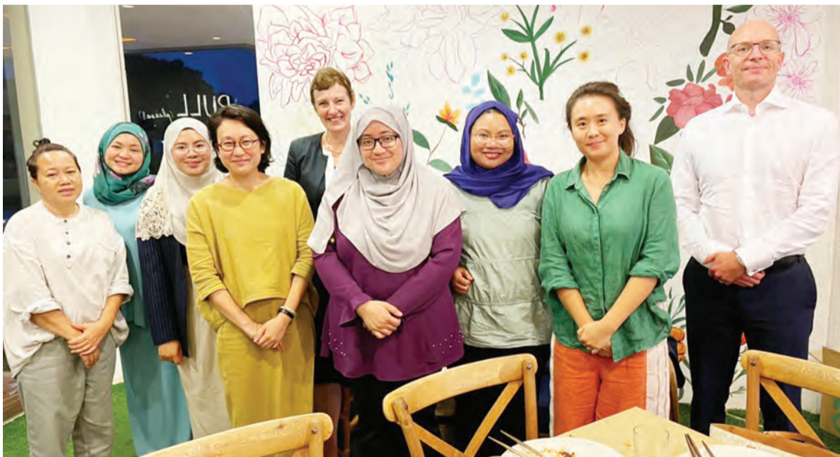
YANG Berhormat Ahli Majlis Mesyuarat Negara (empat, kanan) pada sesi bergambar ramai pada sesi dialog berkenaan.