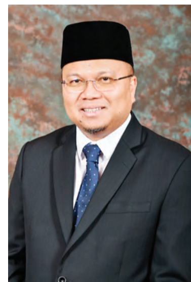
PERUTUSAN Yang Berhormat Menteri Kesihatan sempena Sambutan Hari Kanser Sedunia 2021.

Oleh itu, ujar Yang Berhormat, orang ramai adalah sangat