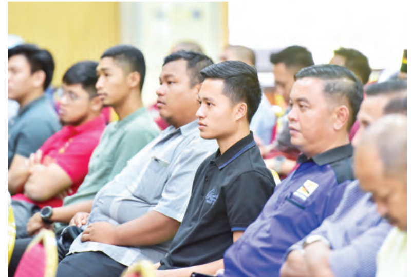
PARA peserta yang hadir pada majlis tersebut.

Majlis penutup tersebut juga dihadiri oleh Setiausaha-setiausaha Tetap dan Timbalan-timbalan Setiausaha Tetap Kementerian Hal Ehwal Dalam Negeri dan Kementerian Kebudayaan Belia dan Sukan, Pegawai-pegawai Daerah, Pengarah NDMC serta Ketua-ketua Jabatan berkenaan dan Ketua-ketua Badan Organisasi berkenaan.