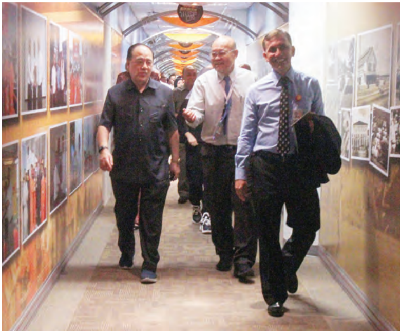
YANG Berhormat Menteri Tenaga turut mengiringi rombongan semasa lawatan Ahli-ahli MMN ke Brunei Shell Petroleum Sdn. Bhd.

Oleh : Noraisah Haji Muhammed