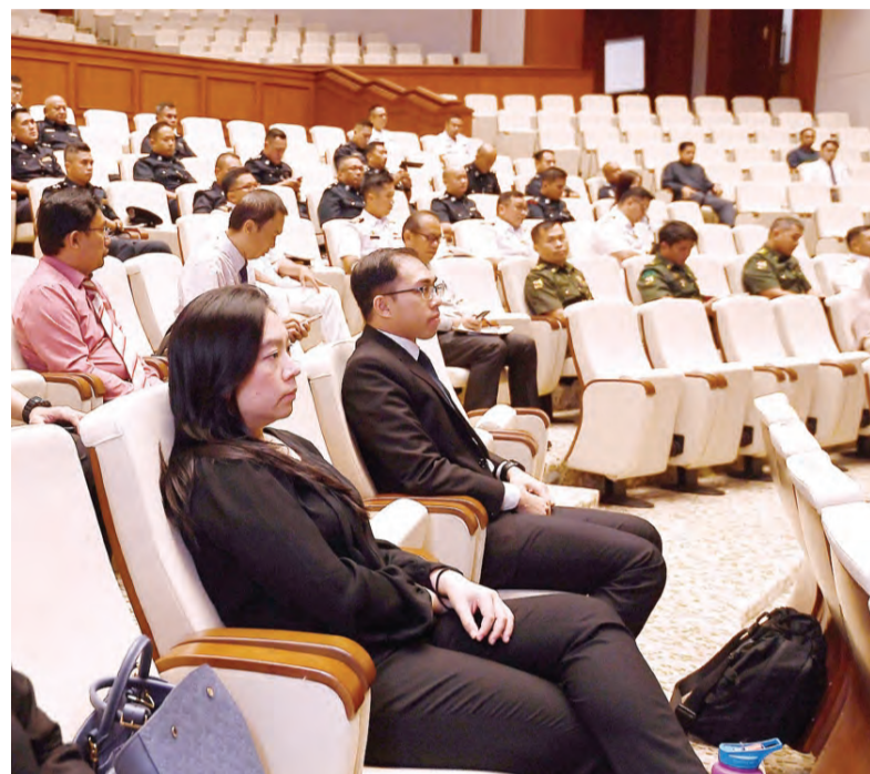
ANTARA pegawai kanan dari agensi keselamatan dan ahli-ahli di dalam JKPU dan JKKM yang hadir.

Bengkel tersebut telah dikoordinasikan oleh Pusat Penyelarasan Maritim Kebangsaan (PPMK) berserta Sekretariat