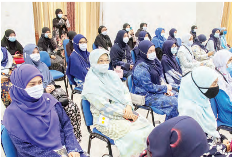
PARA belia yang mengikuti Akademi Da'wah 3.0 tersebut semasa melafazkan ikrar (kanan).

Selain itu, untuk melahirkan da'ie yang dapat melaksanakan dakwah di dalam bidang masing-masing berteraskan kefahaman Al-Quran dan As-Sunnah yang maksima dan digital-friendly serta sebagai pendedahan ( awareness ) kepada orang awam mengenai penubuhan Belia Da'ie sebagai wadah untuk berdakwah, khususnya golongan muda.