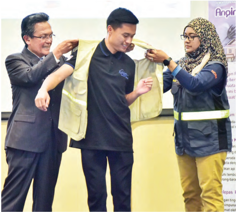
BANDAR SERI BEGAWAN, Khamis, 4 Februari. - Pusat