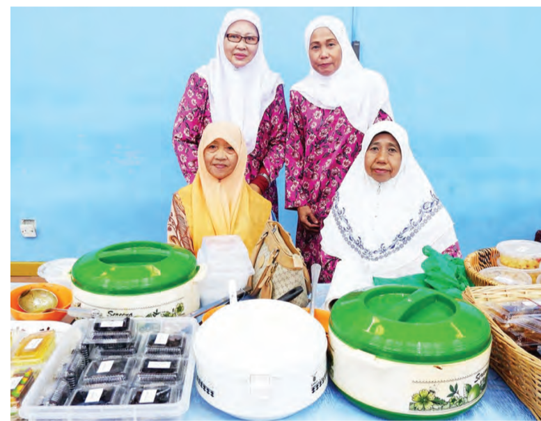
PRODUK-produk yang juga dihasilkan oleh Ahli-ahli PKWE bagi Cawangan Daerah Brunei dan Muara (atas). Sementara gambar bawah kiri dan bawah kanan, antara pegawai dan kakitangan kerajaan yang mengikuti Kursus Persediaan Persaraan yang dianjurkan oleh Institut Perkhidmatan Awam bermula pada 1 Februari yang lalu.

Selain itu, pusat ini juga bergiat aktif dalam perekonomian, di mana ahli-ahli pusat juga menghasilkan produk masakan, kuih-muih dan sebagainya.