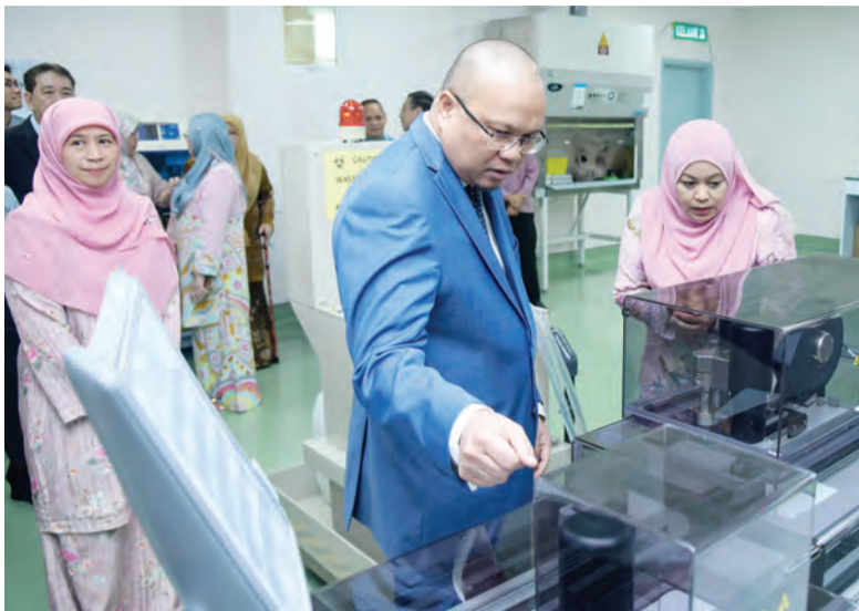
YANG Berhormat Menteri Kesihatan semasa meninjau Sistem Automasi Makmal Menyeluruh bagi Makmal Rujukan Kimia Klinikal Kebangsaan di Hospital Raja Isteri Pengiran Anak Saleha.

BANDAR SERI BEGAWAN , Khamis, 4 Februari. - Jabatan Perkhidmatan Makmal mengadakan Majlis Pelancaran Sistem Automasi Makmal Menyeluruh (Total Laboratory Automation System) bagi Makmal Rujukan Kimia Klinikal Kebangsaan atau National Clinical Chemistry Reference Laboratory di Hospital Raja Isteri Pengiran Anak Saleha (RIPAS), di sini.