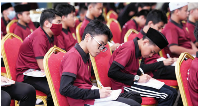
PARA penuntut Tahun 7 yang menghadiri Taklimat Kenegaraan tersebut.

Taklimat diakhiri dengan penyampaian hadiah kepada para penuntut yang berjaya menjawab kuiz kenegaraan yang disampaikan oleh Pengetua Ma'had Islam Brunei.