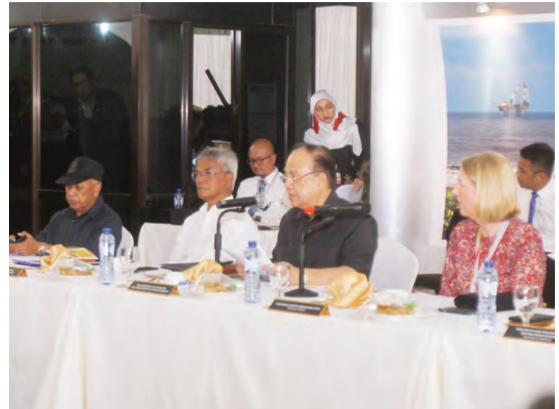
YANG Berhormat Menteri Tenaga (depan, dua dari kanan) bersama Yang Mulia Timbalan Menteri Tenaga (depan, dua dari kiri) menyertai Ahli-ahli Majlis Mesyuarat Negara (MMN) pada lawatan ke Brunei Shell Petroleum Sdn. Bhd.

Semasa lawatan ke Brunei Shell Petroleum Sdn. Bhd., Ahli-ahli MMN berkesempatan untuk