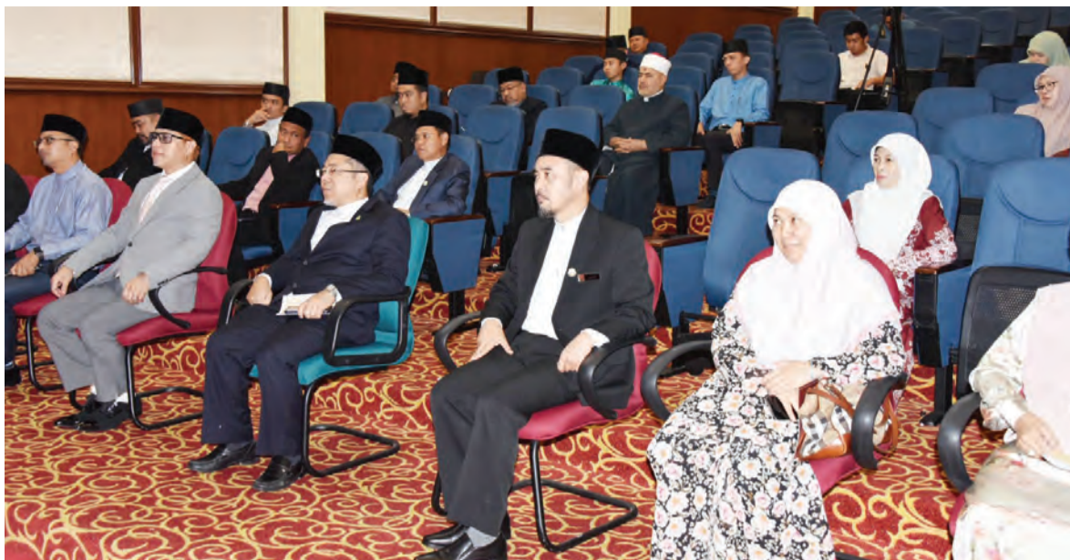
REKTOR UNISSA yang juga selaku Ahli Majlis KUPU SB (tengah) dan Ra'es KUPU SB (dua, kiri) semasa hadir pada majlis pembukaan bengkel tersebut.