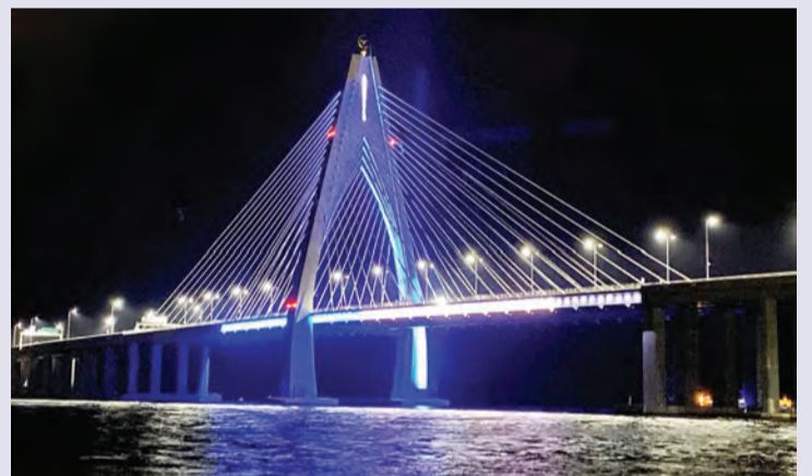
NEGARA Brunei Darussalam menyambut Sambutan Hari Kanser Sedunia dengan menghiasi Jambatan Raja Isteri Pengiran Anak Hajah Saleha (RIPAHS) dan Jambatan Sultan Haji Omar 'Ali Saifuddien dengan lampu warna oren dan biru bermula pada jam 7.00 malam (bawah dan atas).

Siaran Akhbar : Kementerian Kesihatan