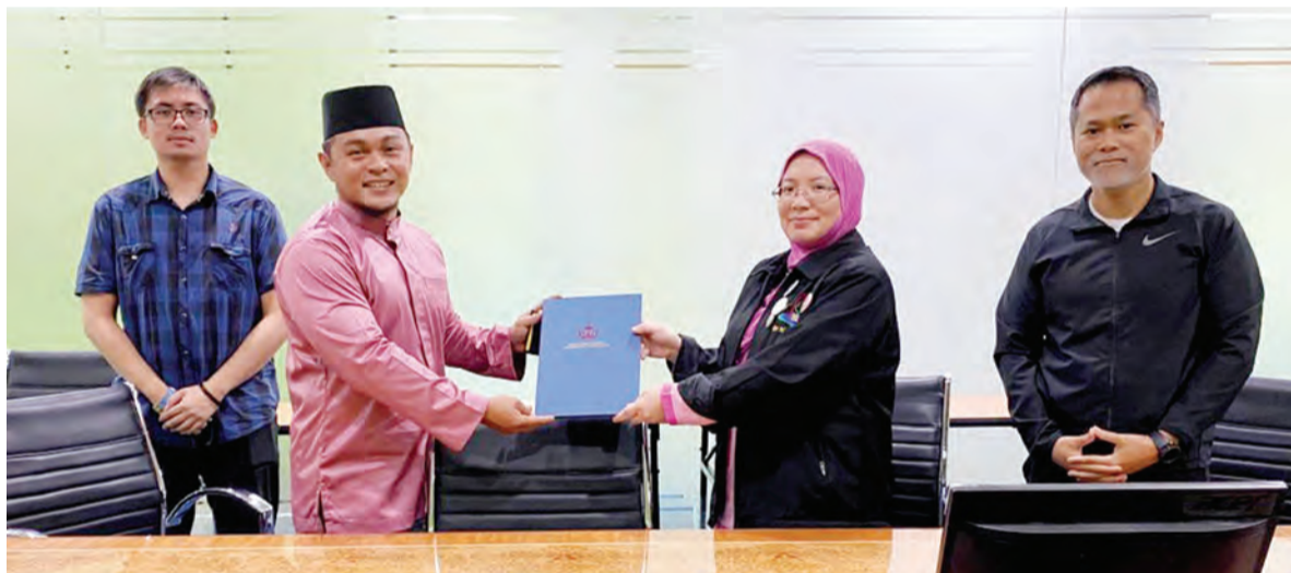
MAJLIS Penandatanganan Perjanjian Kontrak dan Taklimat untuk 13 Studio-studio Kecergasan.