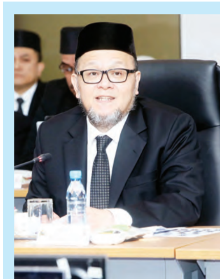
MENTERI Pendidikan, Yang Berhormat Dato Seri Setia Awang Haji Hamzah bin Haji Sulaiman semasa berucap pada Sesi Muzakarah bersama Ahli-ahli Majlis Mesyuarat Negara (MMN) pada Sabtu, 9 Jamadilakhir 1442 Hijrah / 23 Januari 2021 Masihi di Dewan Persidangan 1, Kementerian Pendidikan.

Dalam menangani keperluan teknologi para pelajar, beberapa inisiatif telah diambil. Kementerian Pendidikan telah bekerjasama rapat dengan Kementerian Pengangkutan dan Infokomunikasi (MTIC), Pihak Berkuasa Industri Teknologi Infokomunikasi Negara Brunei Darussalam (AITI) serta syarikat-syarikat telekomunikasi swasta dalam menyediakan peranti ( devices ) dan akses