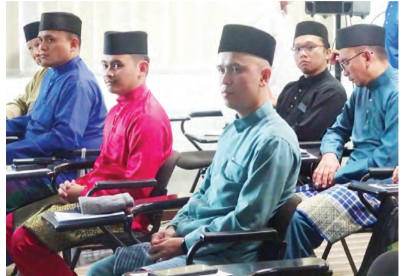
ANTARA peserta Skim Bimbingan Asas Muallaf 14 Hari Siri Ke-193 yang hadir.