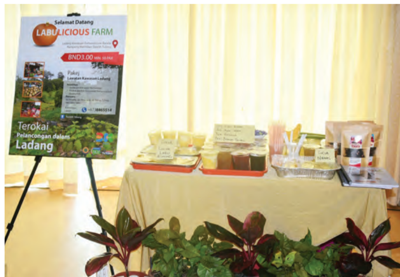
PROJEK yang diketengahkan oleh MPK Merimbun dan Kuala Ungar.

Bagi maklumat lanjut bolehlah melayari laman sesawang www.tutong.gov.bn atau tutong.click atau melalui media sosial Instagram di @jabatan_daerah_tutong .