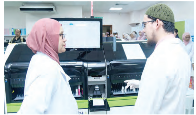
PEGAWAI Jabatan Perkhidmatan Makmal semasa mengendalikan mesin makmal yang baharu tersebut.