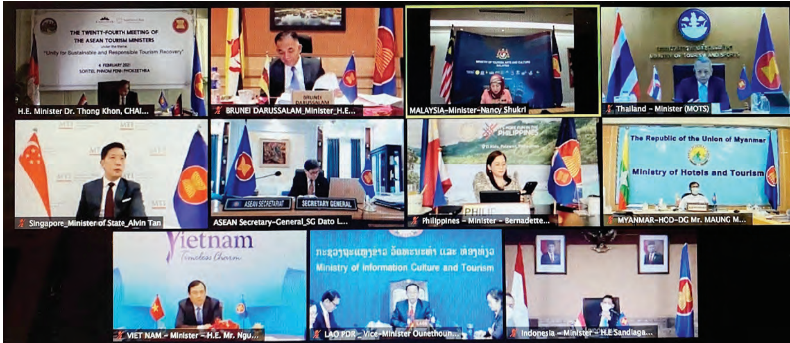
Siaran Akhbar dan Foto : Kementerian Sumber-Sumber Utama dan Pelancongan

YANG Berhormat Menteri Sumber-Sumber Utama dan Pelancongan mewakili Negara Brunei Darussalam bersama Menteri-Menteri Pelancongan ASEAN menghadiri Mesyuarat Menteri-Menteri Pelancongan ASEAN Ke-24, Mesyuarat Menteri-Menteri Pelancongan ASEAN + 3 (China, Jepun dan Republik Korea) Ke-20; dan Mesyuarat Menteri-Menteri Pelancongan ASEAN dan India Ke-8 melalui persidangan video pada 2 hingga 5 Februari 2021 (atas dan bawah).