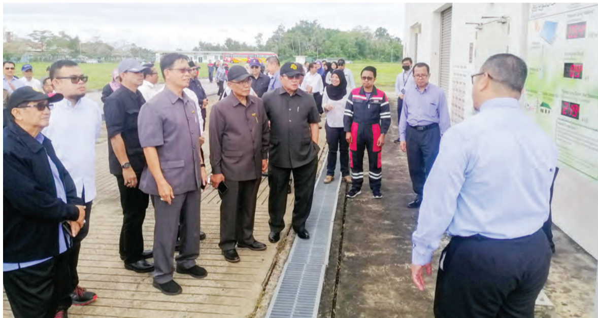
AHLI -ahli MMN mendengar penerangan pada lawatan ke Panel Solar Tenaga Suria Brunei.

Susulan selepas Lawatan Kerja, muzakarah, seterusnya akan diadakan bersama Ahli-ahli MMN, pada 9 Februari akan datang.