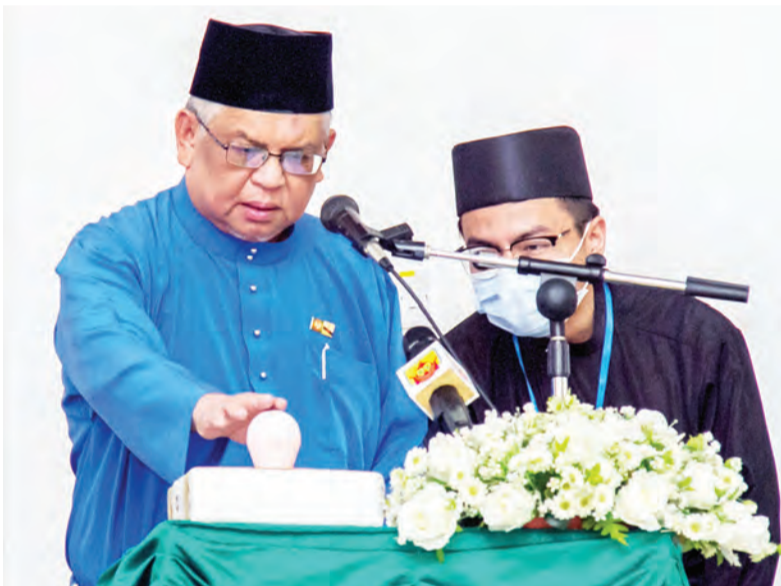
YANG Mulia Timbalan Menteri Hal Ehwal Ugama semasa merasmikan Akademi Da'wah 3.0 di Dewan Multaqa, Bangunan Kementerian Hal Ehwal Ugama (atas). Manakala gambar bawah, para jemputan dan belia yang menghadiri majlis perasmian tersebut.