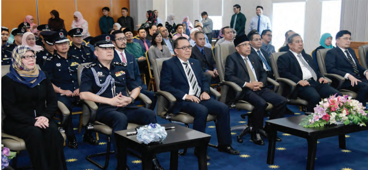
YANG Berhormat Menteri Pembangunan (depan, empat dari kiri) semasa hadir selaku tetamu kehormat pada Majlis Penyerahan Dokumen Pelan Induk Akademi Polis yang diadakan di Dewan Atria Simpur, Jabatan Kerja Raya (atas). Manakala gambar kanan, Yang Berhormat menyerahkan Dokumen Pelan Induk Akademi Polis kepada Pesuruhjaya Polis, Pasukan Polis Diraja Brunei (PPDB).