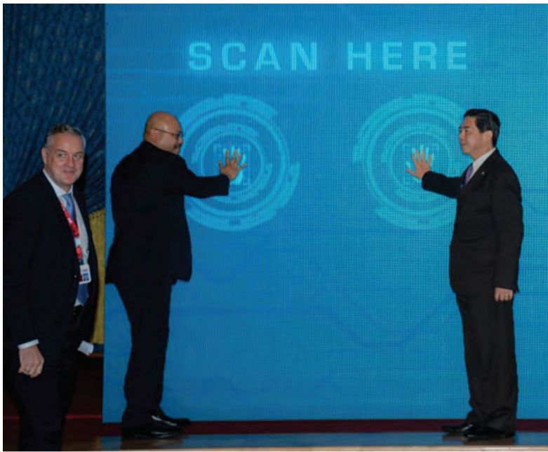
YANG Berhormat Menteri di Jabatan Perdana Menteri dan Menteri Kewangan dan Ekonomi II juga selaku Pengerusi UNN dan Yang Berhormat Menteri Pengangkutan dan Infokomunikasi semasa hadir pada majlis pelancaran tersebut (atas dan kanan).