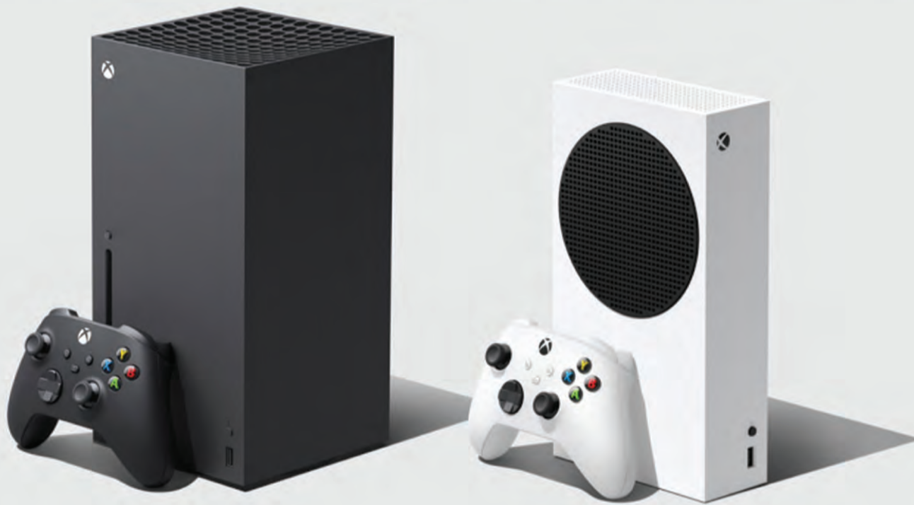
MICROSOFT menghasilkan dua konsol permainan video generasi baharu bagi memperkasa pengalaman pengguna dalam bermain permainan video, iaitu Xbox Series X dan Xbox Series S.

PADA era digital yang berkembang ini, permainan video memainkan peranan yang tersendiri dalam kehidupan kita. Permainan video mampu mencetuskan imaginasi kreatif kita yang hebat dan tanpa had serta menghubungkan kita dengan dunia baharu, cerita-cerita menarik dan rakan-rakan kita.